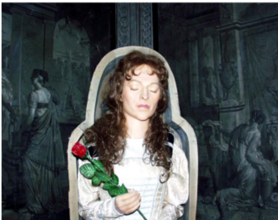
umělá panna Sirahel Edward Kelley