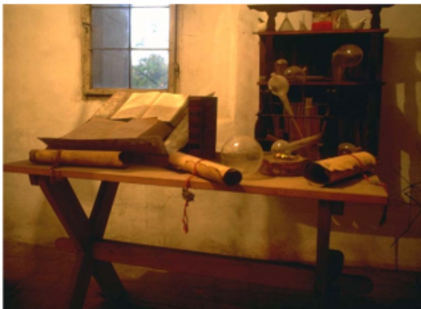
Tycho de Brahe